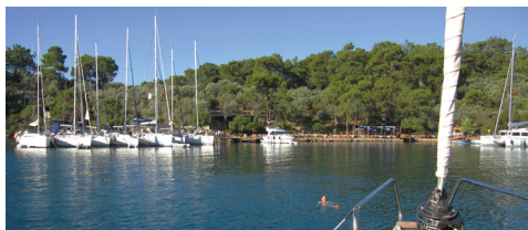
Trend Sailing / Thomas Scheutzel